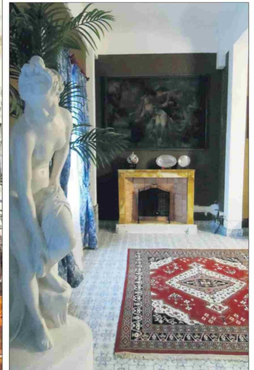
La decoración interior también remite al pasado.

La obra está inspirada en los grandes palacios renacentistas venecianos.