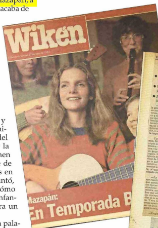
Mazapán y su presencia en “El Mercurio” en los años 80.