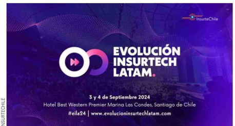
El mundo de las aseguradoras y la tecnología se fusiona en este evento.

En el marco del evento Evolución Insurtech Latam 2024 (EILA), se realizará la premiación del Concurso de Innovación Tech para Seguros, cuyo proceso de recepción de proyectos y evaluación había comenzado con anterioridad. Los premios a los finalistas buscan incentivar las tecnologías más avanzadas que revolucionen los procesos de seguros de vida y generales. La competencia ofrece a las empresas la oportunidad de presentar sus Proof of Concept (POC) y demostrar cómo sus soluciones innovadoras pueden transformar el sector asegurador. El primer lugar obtendrá US$ 2.000 y 20 horas de mentoría con aseguradoras e insurtech relevantes.