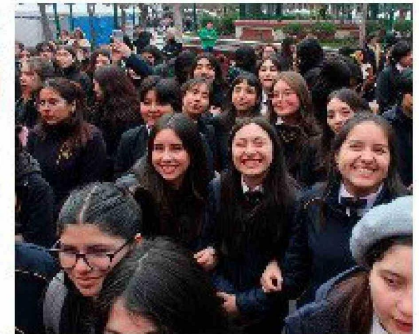
Liceo de Niñas de Rancagua celebra 118 años de tradición y excelencia educativa.