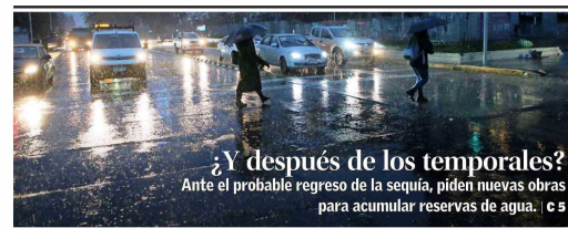
¿Y después de los temporales? Ante el probable regreso de la sequía, piden nuevas obras para acumular reservas de agua. | 5

Pese a despacho de ley corta, advirtió presidente de aseguradoras privadas, la crisis del sector "aún no está superada". | 9