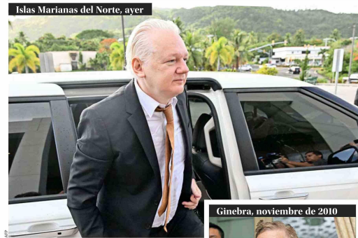
Islas Marianas del Norte, ayer

EL FERROCARRIL, UN ÍTEM FRECUENTE EN LA AGENDA PRESIDENCIAL | 1