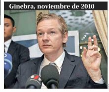
Ginebra, noviembre de 2010

El fundador de WikiLeaks aceptó declararse culpable ante un tribunal estadounidense en el Pacífico, en el marco de un acuerdo que le permitió recuperar la libertad, después de casi 14 años de un proceso por filtrar información clasificada. Se le darían cinco años por el cargo que reconoció y se contabilizarían sus años de prisión en Londres. 4