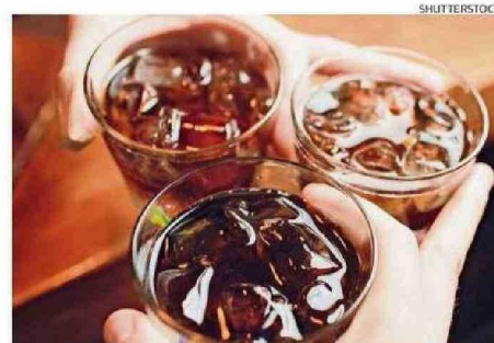
LO INVESTIGÓ LA ORGANIZACIÓN EL PODER DEL CONSUMIDOR.