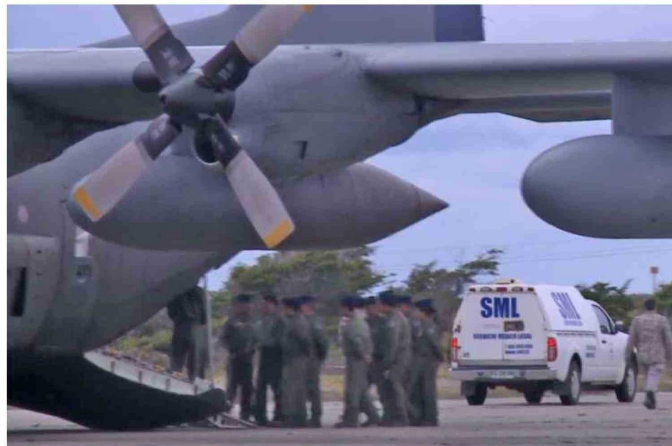
Algunas pericias estuvieron a cargo del Servicio Médico Legal.

“Exactamente. Por otro lado, cuando uno expone los antecedentes de cuál fue la vinculación que tiene con el hecho que está investigando, eso es un elemento esencial que él debió haber colocado y que no ha considerado. Eso resta objetividad e imparcialidad. Pero todo eso se va a discutir en el juicio”.