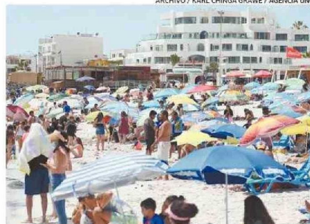
VECINOS RECLAMAN POR EL POCO ESPACIO PÚBLICO DEL BALNEARIO.

Ambos dirigentes vecinales plantean que si bien hay autorización de otras instituciones a las obras, es la Municipalidad la que en último término debe definir y no lo habría hecho pensando integralmente en los bal-