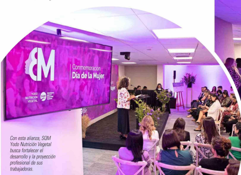
Con esta alianza, SQM Yodo Nutrición Vegetal busca fortalecer el desarrollo y la proyección profesional de sus trabajadoras.