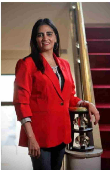
Claudia Sanhueza, subsecretaria Subrei.

zajstán. “De hecho, África se ha posicionado como una de las zonas con mayor crecimiento para los envíos Pmets, a una tasa promedio anual de 21% desde 2017, siendo así el continente con mayor crecimiento de las exportaciones luego de Medio Oriente (52%)”, sostiene el estudio de la subsecretaría.