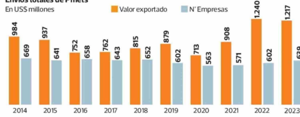
Envíos totales de Pmets En US$ millones