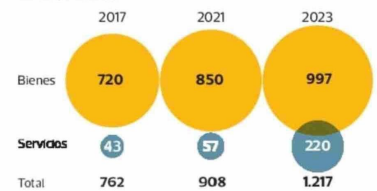
Evolución de la composición de exportaciones Pmets En US$ millones