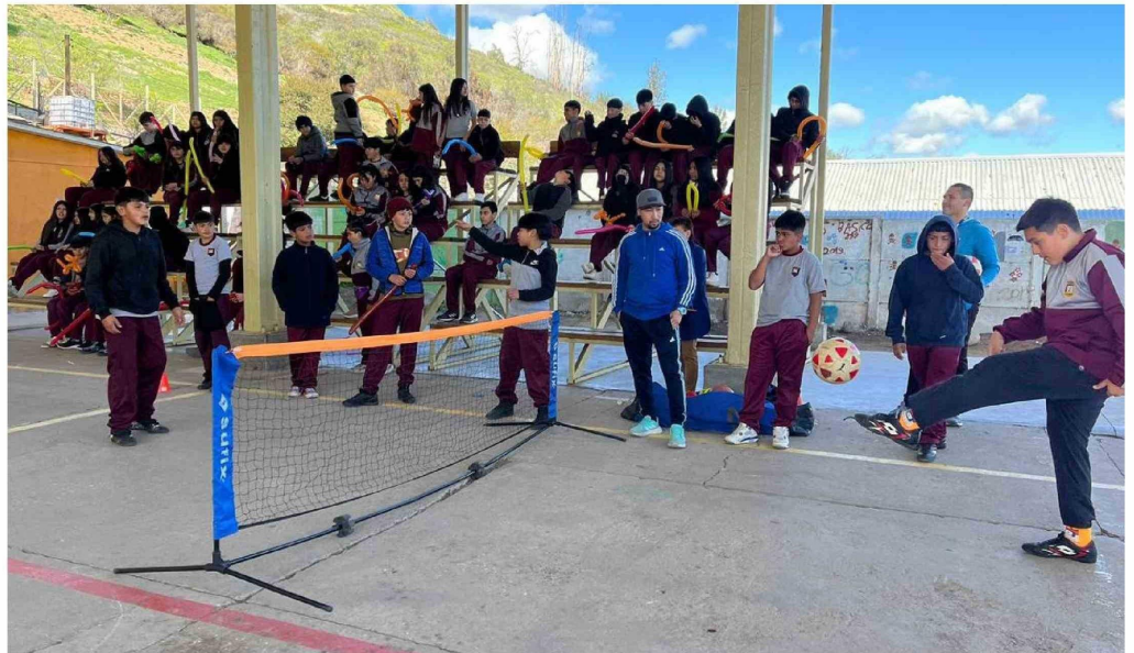
La realización de actividades deportivas también se incluyó en la jornada.

La jornada incluyó una variedad de actividades, entre ellas, baile entretenido, búsqueda del tesoro, el "twister