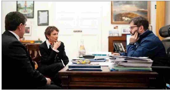
El Presidente Boric llegó desde Paraguay ayer en la tarde y se trasladó a La Moneda a reunirse con la ministra del Interior, Carolina Tohá, y el subsecretario Manuel Monsalve, en el Palacio de la Moneda, para ponerse al tanto de las acciones que tomará el Gobierno.

Dentro de las propuestas que más llamaron la atención estuvo la de la comisión política del Partido Comunista, que pidió "un gran acuerdo nacional" con el objetivo de "enfrentar y erradicar el crimen organizado y el