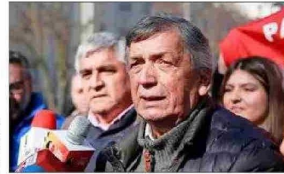
El presidente del PC, Lautaro Carmona, cuya comisión política solicitó un "gran acuerdo nacional" para combatir el crimen organizado.