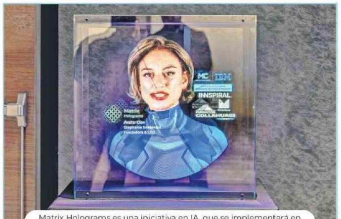
Matrix Holograms es una iniciativa en IA, que se implementará en el Liceo Minero Juan Pablo II y Liceo de Pica a partir de septiembre.

compromiso de Collahuasi con la enseñanza escolar en la región. "Es fantástico el aporte que Fundación Collahuasi ha hecho por la educación en Tarapacá, apostando hoy por la innovación. La tecnología lo puede cambiar todo y, para implementarla, es clave articular esfuerzos entre estudiantes, profesores y directivos, ya que todos se beneficiarán, mejorando el desempeño académico", dijo.