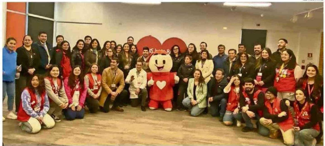
UNOS 25 REPRESENTANTES DE EMPRESAS Y SERVICIOS PÚBLICOS LOCALES PARTICIPARON AYER EN LA CUENTA PÚBLICA DE TELETÓN TEMUCO.

“Estamos desarrollando el programa Gestión e Inclusión que complementa la actividad terapéutica con el desarrollo de capacidades blandas de los pacientes, la autonomía y vincularlos de mejor manera con las redes; también nos permite trabajar más con el cuidador, que es una persona muy importante para la calidad de vida del paciente y para lograr