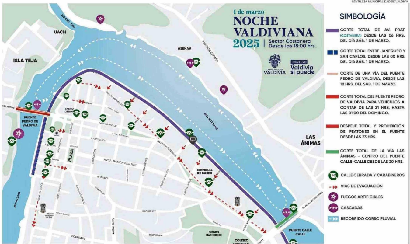
IMAGEN DISEÑADA POR LA MUNICIPALIDAD DE VALDIVIA QUE DA CUENTA DE LOS DISTINTAS ACCIONES INVOLUCRADAS EN LA JORNADA DE CONVOCATORIA MASIVA.

CELEBRACIÓN. Mañana y hasta las 2:00 A.M. del domingo no estará permitido el tránsito vehicular por la Avenida Arturo Prat. Organizadores informaron además de las restricciones que se aplicarán en los puentes Pedro de Valdivia y Calle Calle.