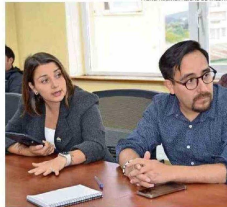
AYER FUE LA REUNIÓN DE COORDINACIÓN DE SEGURIDAD.

Ante la realización de este evento, tanto Carabineros como el municipio dispondrán de stands en los que se entregarán pulseras de identificación a niños y personas mayores, con el fin de facilitar su reencuentro con familiares o grupos de turistas en caso de extravío.