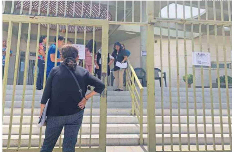
DECENAS DE PERSONAS ACUDIERON A LOS SERVICIOS MUNICIPALES Y NO FUERON ATENDIDOS DEBIDO AL PARO NACIONAL DE FUNCIONARIOS.

Consultado por las molestias que generó en usuarios de la APS y de servicios municipa-