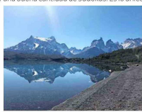
Torres del Paine.