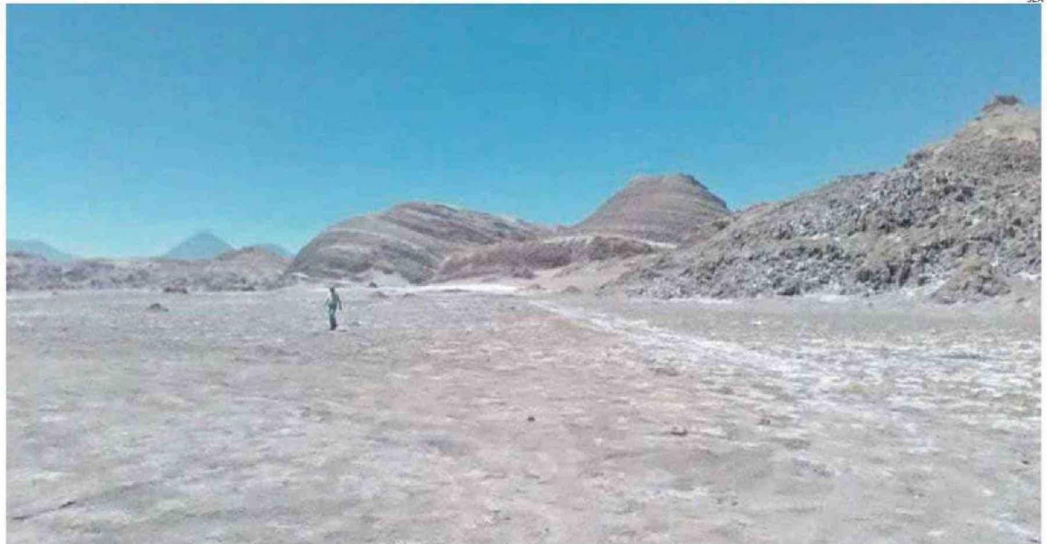
EL PASADO LUNES 15 DE JULIO, LA MINERA GALAXI 1 INGRESÓ AL SEA LA CONSULTA DE PERTINENCIA DE SU PROYECTO "REACTIVACIÓN EXPLORACIÓN MINERA DE CLORURO DE SODIO".