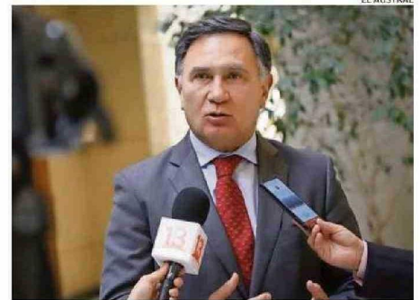
EL DIPUTADO MIGUEL MELLADO (RN) EXIGE MÁS SEGURIDAD.