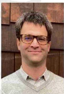
Fund manager de Venture Capital de Sudlich