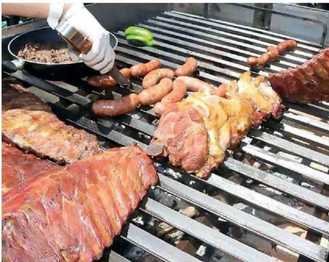
EN DOS SEMANAS INICIARÁN LAS FIESTAS PATRIAS.

La Estrella hizo un recorrido por carnicerías y supermercados para ver las diferencias de precios antes de que empiecen las celebraciones.