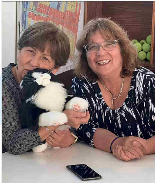
Estos "cuchobots" fueron usados en un centro del Senama de San Miguel.