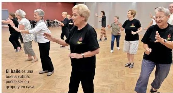
El baile es una buena rutina: puede ser en grupo y en casa.