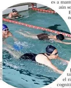
La natación es muy recomendada, pues no impacta las articulaciones y es un buen ejercicio de cardio.

Otras opciones son el trote suave, bicicleta en plano o con pequeños desniveles, trekking a ritmo suave a moderado, y tenis. Este último mejora el estado físico general, reduce la tensión arterial, aumenta la agilidad y reflejos, y como es aeróbico, ayuda a la actividad cardíaca. Los especialistas coinciden también en los beneficios de nadar, por las ventajas que tiene en el cuerpo de alguien mayor: no tiene impacto en las articulaciones y es un excelente ejercicio cardiorespiratorio.