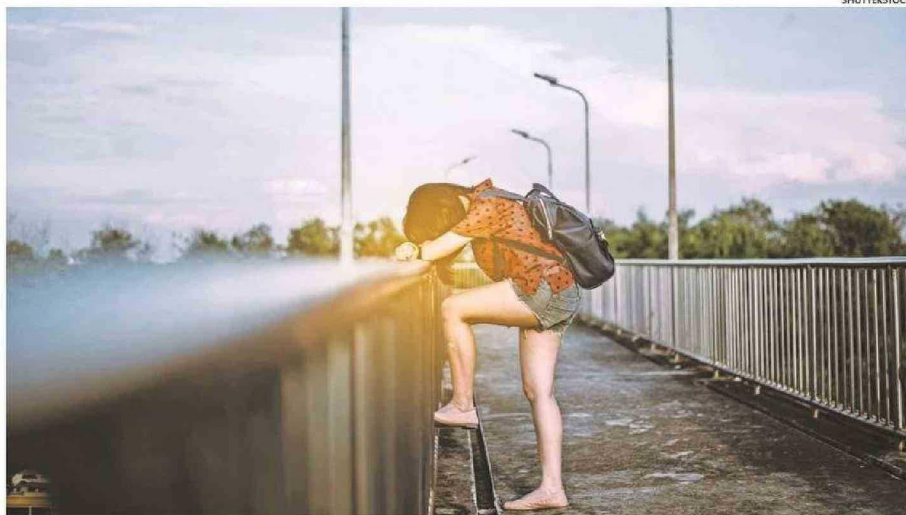
LA ORGANIZACIÓN MUNDIAL DE LA SALUD (OMS) ASEGURA QUE EL SUICIDIO ES UN PROBLEMA DE SALUD PÚBLICA A NIVEL GLOBAL.