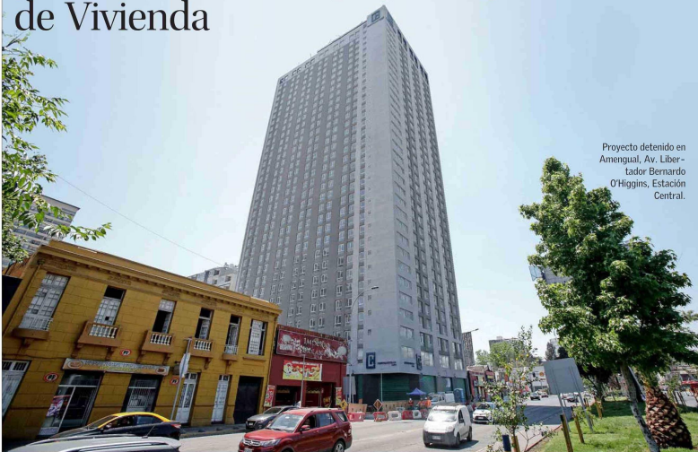
Proyecto detenido en Amengual, Av. Libertador Bernardo O'Higgins, Estación Central.

Son tres proyectos terminados y tenían una fecha de entrega estimada para 2021, pero no se ha cumplido porque la municipalidad "desconoce los permisos". E incluso —acusa la empresa— han incumplido dictámenes de Contraloría. Hoy Vivienda tiene la última palabra. "Estamos trabajando para que (la resolución) sea este año. No queremos dejar en incertidumbre ni a la inmobiliaria, ni a las familias, ni a Estación Central", señala la seremi. • GUILLERMO V. ACEVEDO