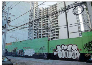
Edificio afectado en Estación Recreo, aún no terminado.

Los proyectos en cuestión comenzaron su desarrollo entre 2014 y 2015. En su momento, comenta el abogado de Grupo Biba, los edificios se construyeron en base a normativas que les permitían tener una altura