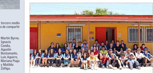
Alumnos del Colegio San Miguel Arcángel en la escuela de Guayacán, Cabildo.