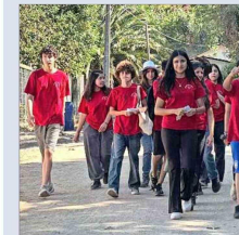
Parte del grupo de estudiantes misionando en Pomaire.