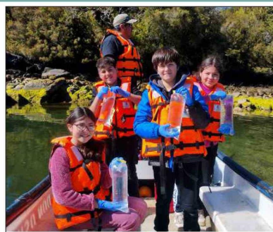
Muestreo de ADN ambiental con los niños y niñas de Puerto Cisnes... foto autorizada