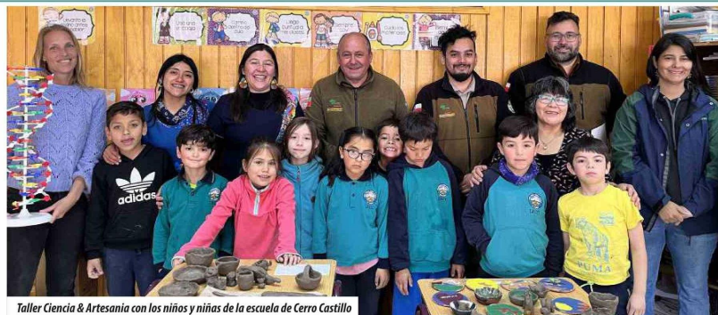
Taller Ciencia & Artesanía con los niños y niñas de la escuela de Cerro Castillo