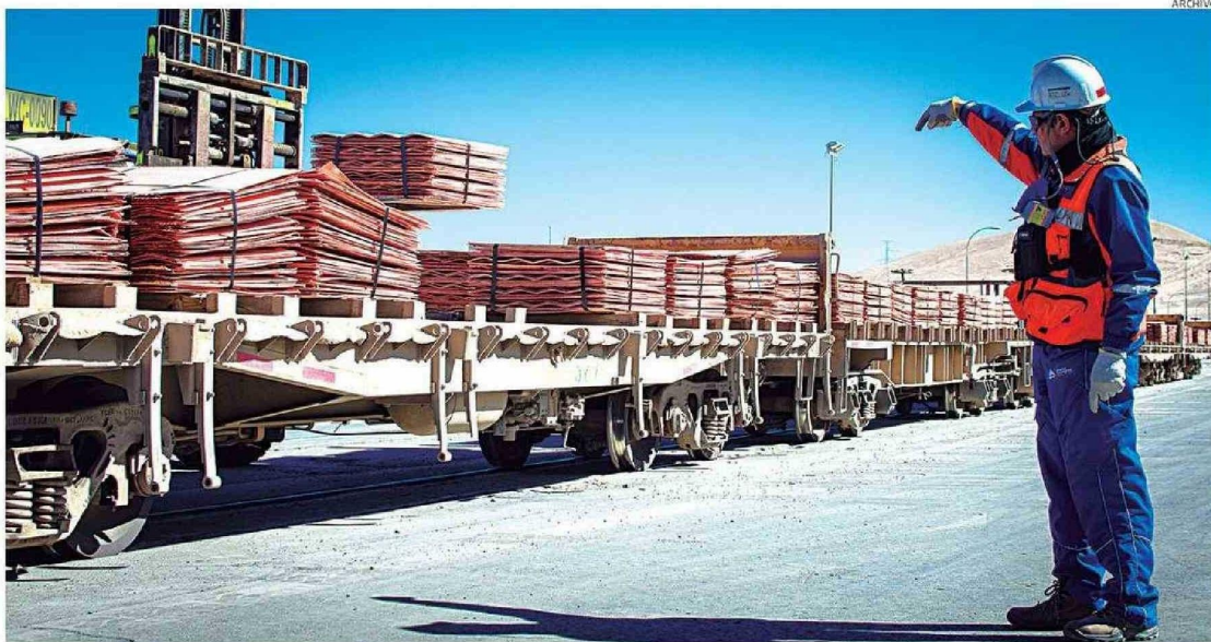
LAS MINERAS POTENCIAN SUS FAENAS PARA MANTENER NIVELES DE PRODUCCIÓN.

José Fco. Montecino Lemus cronica@mercurioantofagasta.cl