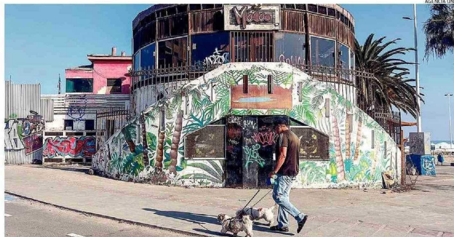
ACTUALMENTE EL INMUEBLE ESTÁ SIENDO UTILIZADO POR PERSONAS EN SITUACIÓN DE CALLE PARA PERNOCTAR.

Por medio del mismo video, Velásquez también se refirió al tema judicial que envuelve al edificio, puesto que argumentó que los locales, "están