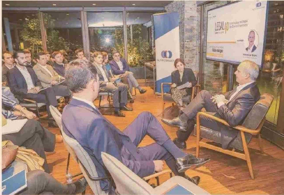
Segundo encuentro Comunidad Legal 40