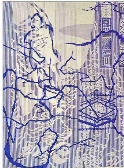
"Mi guatón guapo en la mar", obra textil de Ignacio Urrutia. El artista recibió el tercer lugar.

Municipal de Santiago, cuyos resultados se presentaron el primer semestre en el Centro Cultural La Moneda. Otros certámenes que apuntalan la escena emergente son el del Museo de Artes Visuales (Mavi-UC), que va en su decimoséptima versión y se presenta ahora, y "Artefacto", convocado por la Corporación Cultural de Vitacura. "Siempre es súper importante apoyar al arte joven desde distintos lugares. Estas instancias son muy relevantes para impulsar sus carreras", agrega la directora del MNBA.