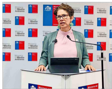
La ministra del Medio Ambiente, Maita Rojas, indicó que "el objetivo principal de esta reforma es el fortalecimiento de la institucionalidad ambiental, haciéndola más eficiente".

dad ambiental, haciéndola más eficiente, sin bajar los estándares medioambientales. Recordemos que una reforma así se había intentado dos veces anteriormente sin éxito, por lo tanto, estamos contentos de terminar esta etapa importante; vienen siguientes etapas para que ojalá podamos tener una reforma prontamente", dijo ayer la ministra del Medio Ambiente, Maita Rojas, tras la aprobación de la comisión en el Senado. Si la comisión de Hacienda aprobó el proyecto de ley, la iniciativa podrá ser votada en la Sala del Senado en particular, con lo que concluirá su primer trámite constitucional. Otras modificaciones Dentro de las modificaciones que contempla el proyecto de ley, se busca fortalecer la rectoría técnica del SEA. Para este propósito, se le entregarán facultades para delimitar el rango de acción de los pronunciamientos de los Organismos de la Administración del Estado con Competencia Ambiental (Ocaea) a las materias que son de su exclusiva competencia. Además, se quiere establecer un procedimiento para urgenciar que permita reducir hasta la mitad los plazos de eva-