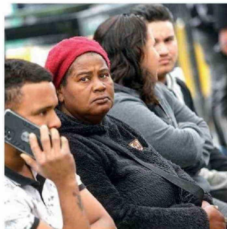
LA REGIÓN CONCENTRA CASI 60 MIL MUJERES MIGRANTES.

mil 439 ciudadanos migrantes residen en la Región de Antofagasta al 2022.