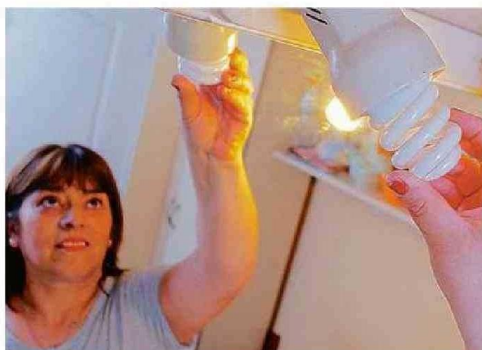
HASTA EL 14 DE JULIO SE PUEDE POSTULAR AL BENEFICIO.