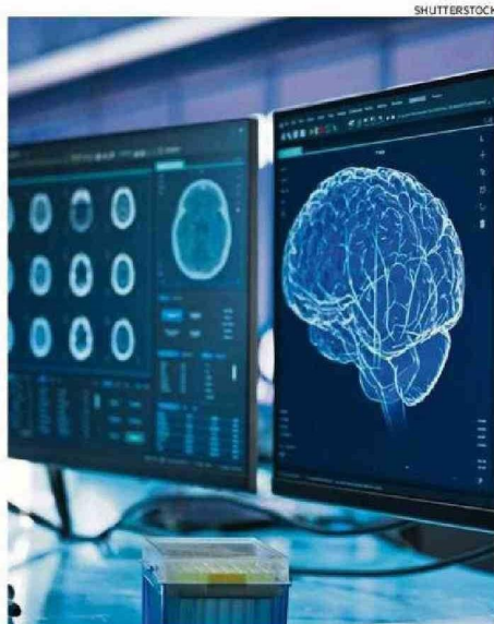
El cerebro humano tiene una gran capacidad.

El equipo observó así que, en ausencia de los bigotes principales, la región del cerebro que normalmente procesa esa información desaparece casi por completo y la región de los bigotes del labio superior, que son más pequeños, numerosos y con funciones secundarias en el procesamiento táctil, se ex-