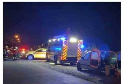
EL RESCATE SE CONCRETÓ DURANTE LA NOCHE.

El fono *4141 es completamente gratuito y se puede llamar desde celulares de lunes a domingo, las 24 horas del día. A través de ella, las personas que estén enfrentando una emergencia o crisis de salud mental asociada al suicidio podrán contactarse con un psicólogo especialmente capacitado que los escuchará y ayudará.