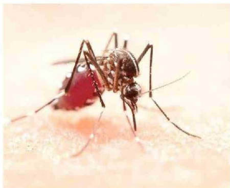
POR LA APARICIÓN DE ZANCUDOS QUE TRANSMITAN ENFERMEDADES COMO DENGUE O MALARIA.