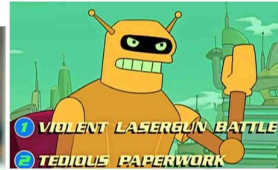
En "Futurama", la audiencia podía incidir en la trama de la película del robot Calculón (arriba). Varios años después, Netflix propuso algo similar en su serie "Black Mirror" (foto izquierda).