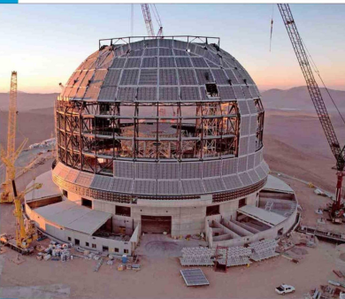
El Smell-O-Scope permitía en la serie oler planetas lejanos. El telescopio ELT, el más grande del mundo y que se construye en el cerro Armazones (arriba), permitirá, entre otras cosas, saber la composición de las atmósferas de los exoplanetas. Esto no solo permite determinar su olor, sino que saber si puede albergar vida.

ESTRENADA EN 1999 POR EL MISMO CREADOR DE "LOS SIMPSON":