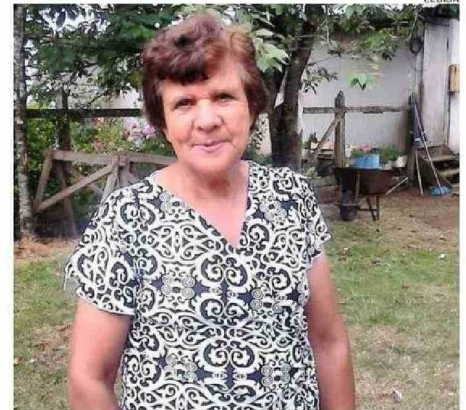
“TITA”, COMO LE DECÍAN DE CARIÑO EN LA COMUNIDAD, TENÍA 79 AÑOS.