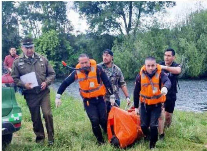
BUZOS DEL GOPE Y UNO PARTICULAR DE LA ZONA EXTRAJERON EL CUERPO DESDE EL RÍO NEGRO.