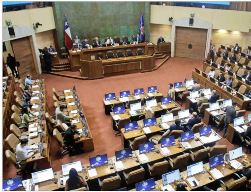
La sala de la Cámara de Diputados debería votar el próximo miércoles la reforma previsional, en tercer trámite. Allí se conocerá si se va a ley o a comisión mixta. Eso dependerá de si los diputados ratifican o no los cambios del Senado.

Quizá la principal aprensión de los expertos está puesta en el ries-