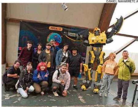
AL EVENTO ASISTIERON PRINCIPALMENTE ESTUDIANTES UNIVERSITARIOS.