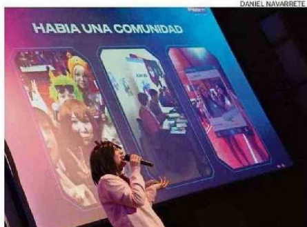
AYER POR LA MAÑANA FUE LA CHARLA SOBRE EL AKIBA FEST.

alguien cercano. Es algo asociado a la pérdida en general de cualquier cosa, incluso de un objeto preciado. El duelo es algo muy humano, es algo que nos conecta como personas”.