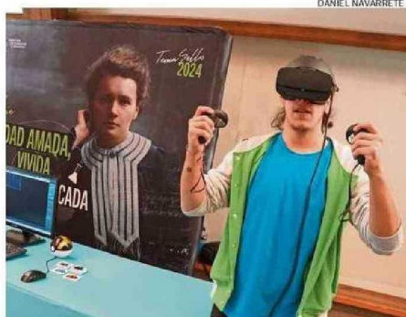
EL STAND DE LA CARRERA DE TÉCNICO EN DISEÑO DE VIDEOJUEGOS.