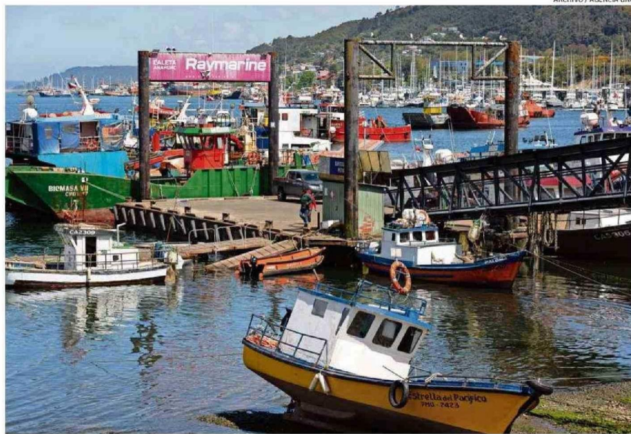
LA ACTIVIDAD DE LA INDUSTRIA ACUÍCOLA Y PESQUERA FUE RELEVANTE PARA ALCANZAR ESTE NIVEL DE DESARROLLO ECONÓMICO EN LOS LAGOS.

En segundo lugar están los servicios personales, como ac-