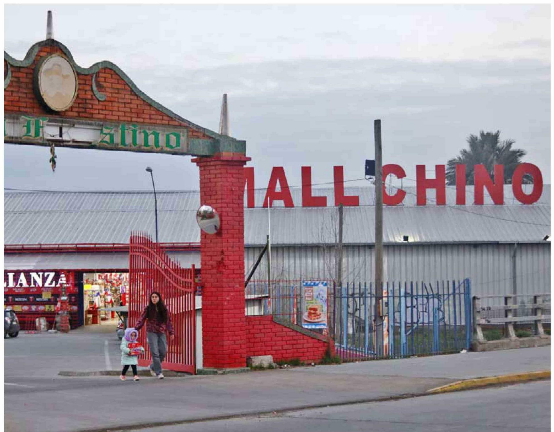
Los locales comenzaron en el centro, pero se han extendido hacia la periferia.