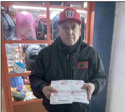
En la imagen se puede apreciar el historial de facturación y pago.

- No lo voy a pagar, obvio, hasta cuando vayan porque yo les dije que estaba ciertos días con descanso y que vayan, vean que yo no tengo adulterado el medidor; ahora si ellos me lo van a abrir, no me vayan a arreglar para que corra más, como según los vecinos se lo hicieron en el mes de enero-febrero. Ahora marzo-abril tampoco Chilquinta tenía los medios como para tener gente viendo los medidores en cada casa y departamentos acá en San Felipe, por qué... porque falta personal tengo entendido.