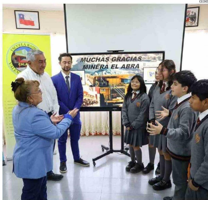
LA ESCUELA D-131 VALENTÍN LETELIER IMPLEMENTARÁ NUEVAS PANTALLAS INTERACTIVAS.