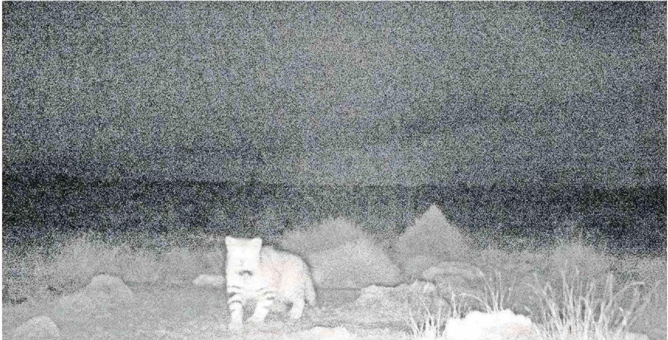
EL GATO COLOCOLO ES UNO DE LOS ANIMALES MÁS DIFÍCILES DE OBSERVAR EN SU HÁBITAT NATURAL. ESTE TIPO DE MONITOREO PERMITO OBSERVARLOS.