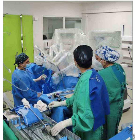
RECINTOS. — Para realizar una solicitud de mediación válida, se requiere que exista un daño al paciente ocasionado con motivo de una prestación en un prestador institucional público que integre las redes asistenciales.

Respecto de los filtros para considerar admisible un reque-