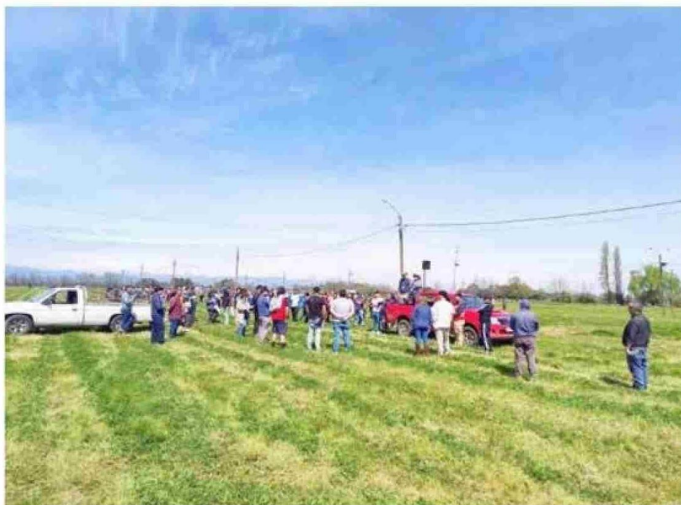
Con el remate de sitios para los comerciantes, que trabajarán en torno al show de tres días en la explanada municipal, partió la cuenta regresiva, de cara a la celebración de un nuevo aniversario.

y la Ruta Pehuenche, que conecta con Argentina a través de la Laguna del Maule.