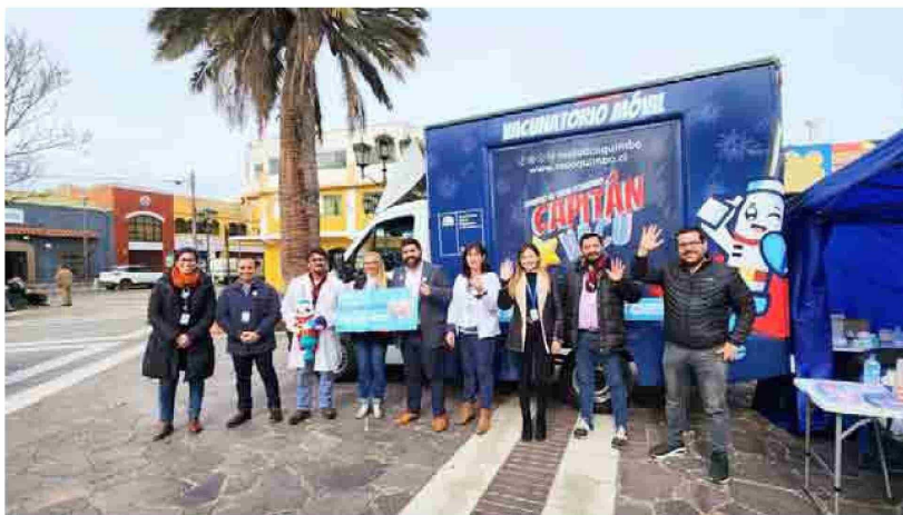
Hasta la plaza de Coquimbo llegó el vacunatorio móvil de la seremi de Salud, con el objetivo de facilitar la vacunación de las personas.