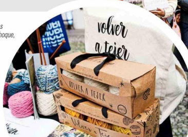
Pack de ovillos de lana del programa “Volver a Tejer”.